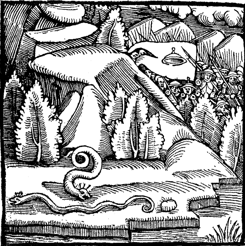
Titel von No. 598.