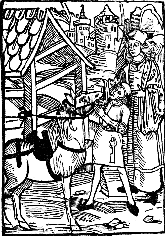
Titel von No. 653.

wie man Pferd ertzneyen / vnd ein yegklichs Pferd erkennen sol.