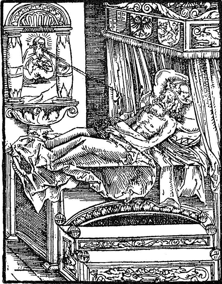
Titel von No. 11.

hochgebornen Fursten vnd hern Sygismundus Konig tzu Angern vnd Behem tzu Priesburg auff den auffartz abent als yr hynach horen werdet vonn der tzerstörung landt vnd Konig r erch vnd vefolaung der Priessterschafft.