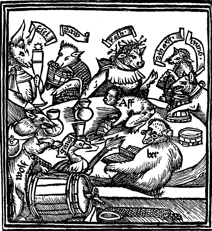
Titel von No. 832.

Questio facetiarum et vrbanitatis plena: spulcerrimis optimorum scriptorum flosculis referta: in conclus sione Quodlibeti Erpburdensis. Anno Christi. M. D. XL. Circa autumnas le equinoctium Scolastico more explicata.