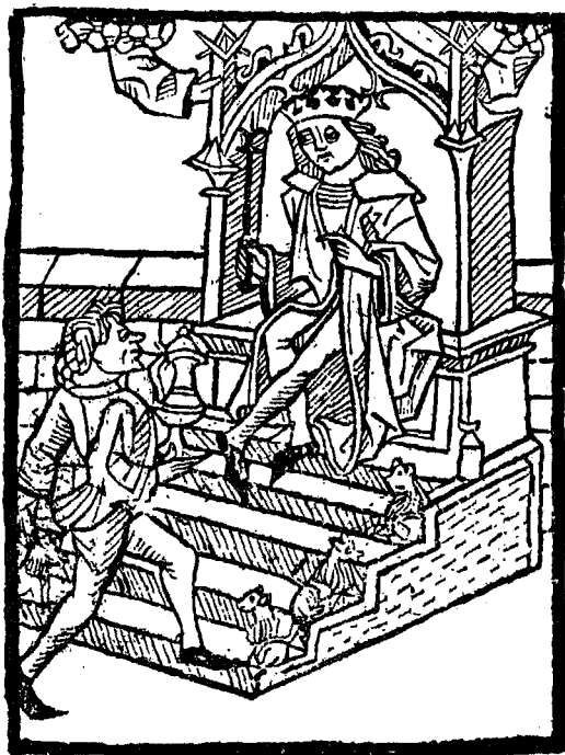
Titel von No. 1851.