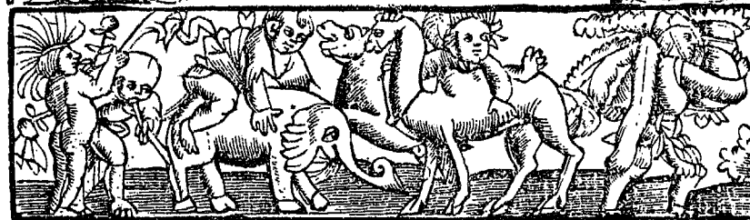
Titel von No. 4206.